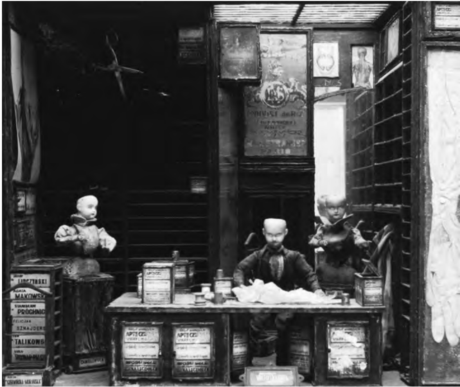
Set für STREET OF CROCODILES (The Quay Brothers, GB 1986)