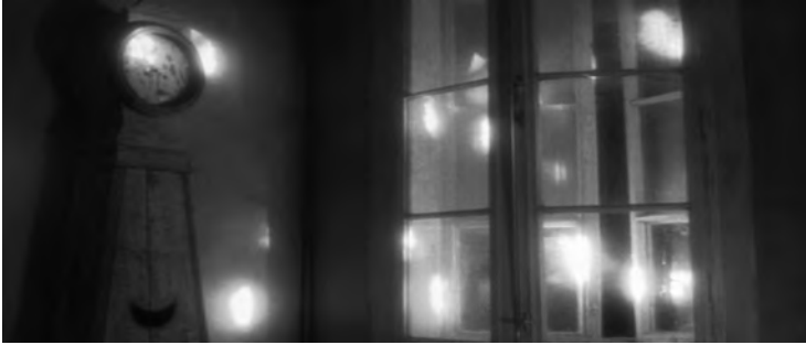
4 Lichtflecken im Studio der Quays

se in pulsierendem Gleißern niederschlug. Lichtmuster und Strahlen waren mit dem Lauf der Sonne quer über die Sets gewandert. Dieser «Fehler», eine veritable «Epiphanie» (Quay Brothers 1996), wurde zur preisgekrönten «Entdeckung des Lichts» von IN ABSENTIA . Die Quays verstärkten und lenkten die Sonnenstrahlen durch Spiegel und Reflektoren, um sie den Erfordernissen der Szenen anzupassen (vgl. Aita 2001, o.S.). Andere frühe Missgeschicke führten zu ähnlich originellen Lösungen: Bei den Dreharbeiten zu STREET OF CROCODILES hinterließ ein Spotlight unerwünschte Effekte auf den Porzellanköpfen im Schneideratelier. Schließlich gelang es, diese Effekte mithilfe von Watte in sanft-glimmende Strahlenkränze zu verwandeln und Licht durch die leeren Augenhöhlen schimmern zu lassen (Abb. 3a–d). Die Wirkung ist schön und unheimlich zugleich, da sie die physische und geistige Leere der Puppen unterstreicht.