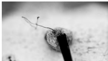
2a-d Rhearsals for EXTINCT ANATOMIES (The Quay Brothers, GB 1987)